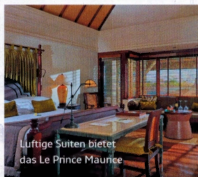
Luftige Suiten bietet das Le Prince Maurice