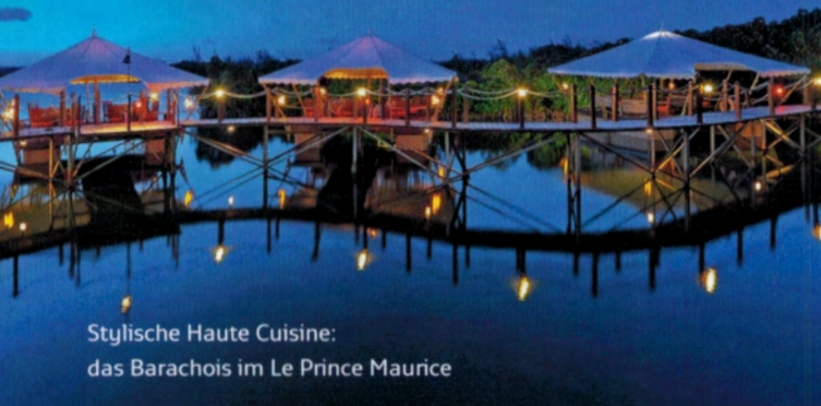
Stylische Haute Cuisine: das Barachois im Le Prince Maurice