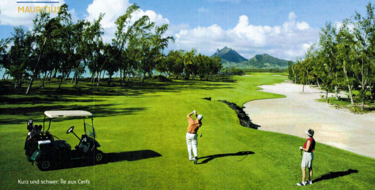
Kurz und schwer: Île aux Cerfs

auch das Wellness- und Beautyangebot ist international beispielhaft. Viele der Top-Resorts, die jeden nur erdenklichen Komfort und Service bieten, findet man in besonders romantischen Lagen. Eine einmalige Flora und Fauna, tropische Parks, smaragdgrüne Lagunen, schneeweiße Sandstrände, herrliche Buchten – in der Tat gibt es hierfür nur ein Wort: paradiesisch!